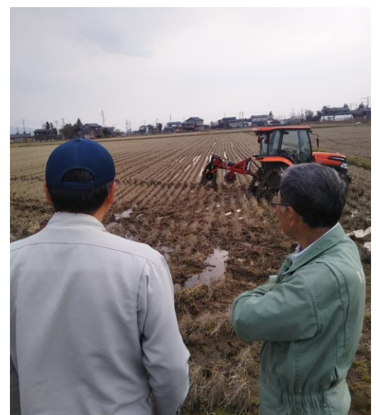
低価格・高精度ナビを用いた作業例

そこでコンソーシアムでは、農業ITベンチャー企業と協力して、半径20キロに及ぶ広範囲でインターネット回線を介して基地局情報を共同利用する仕組みを構築。これにより農業者は設備不要で、手軽かつ安価にスマート農機を利用できる。