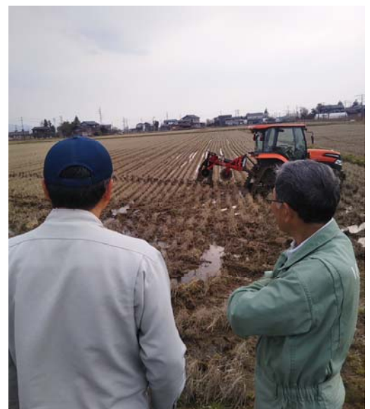
低価格・高精度ナビを用いた作業例

そこでコンソーシアムでは、農業ITベンチャー企業と協力して、半径20キロに及ぶ広範囲でインターネット回線を介して基地局情報を共同利用する仕組みを構築。これにより農業者は設備不要で、手軽かつ安価にスマート農機を利用できる。